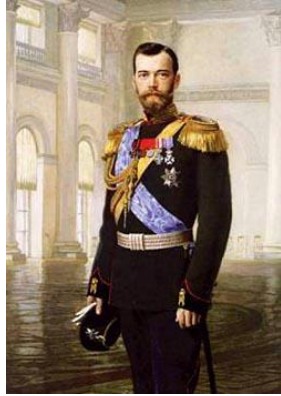
Nicolás II (último zar de Rusia)