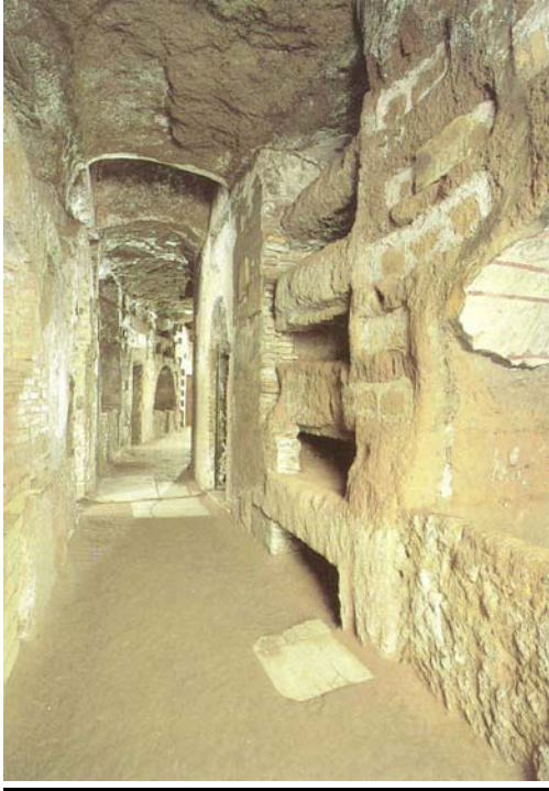
Fotografía de catacumba romana