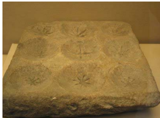
tablero de juego

Sobre la décima hora se tomaba la cena , que era la comida fuerte del día, tenía lugar en el triclinium. Los romanos, comían recostados, apoyados sobre el brazo izquierdo, aunque sólo los varones de las clases sociales más acomodadas.