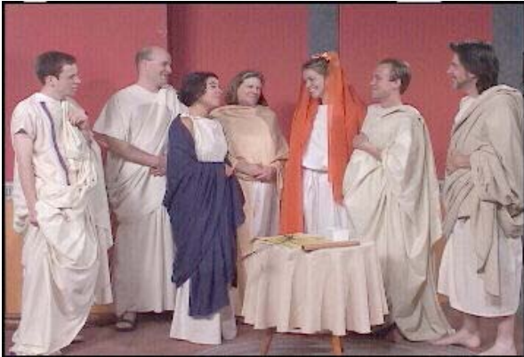
Representación de boda romana.

A finales de la República este tipo de matrimonios desaparece y se generaliza el matrimonio sine manu en el que la mujer tiene más libertad.