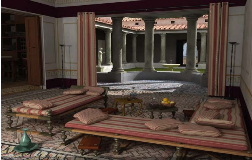
Reconstrucción de un triclinio romano

La cena diaria, que se hacía en familia, consistía en verduras, huevos duros, frutas y vino. Cuando la cena había terminado y la luz solar había desaparecido, se iban a la cama.