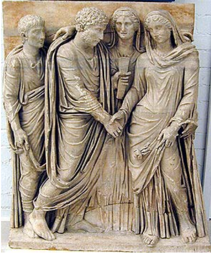
Un matrimonio romano. Detalle de los relieves de un sarcófago. Londres, Museo Británico