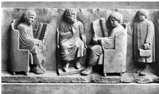
Relieve romano con una escena de escuela

Aprendía a leer escribir y hacer operaciones aritméticas, las lecciones se llevaban a cabo en una habitación, a veces al aire libre.